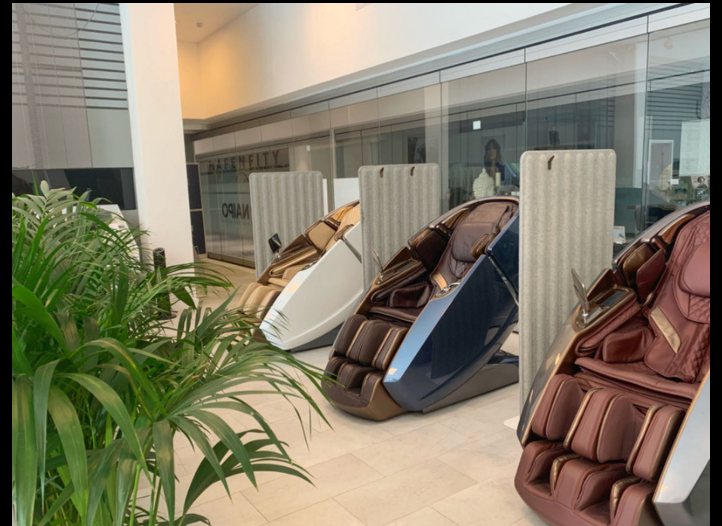
Basis Lounge: neben Showroom-Fläche, 30 und 60 Minuten.