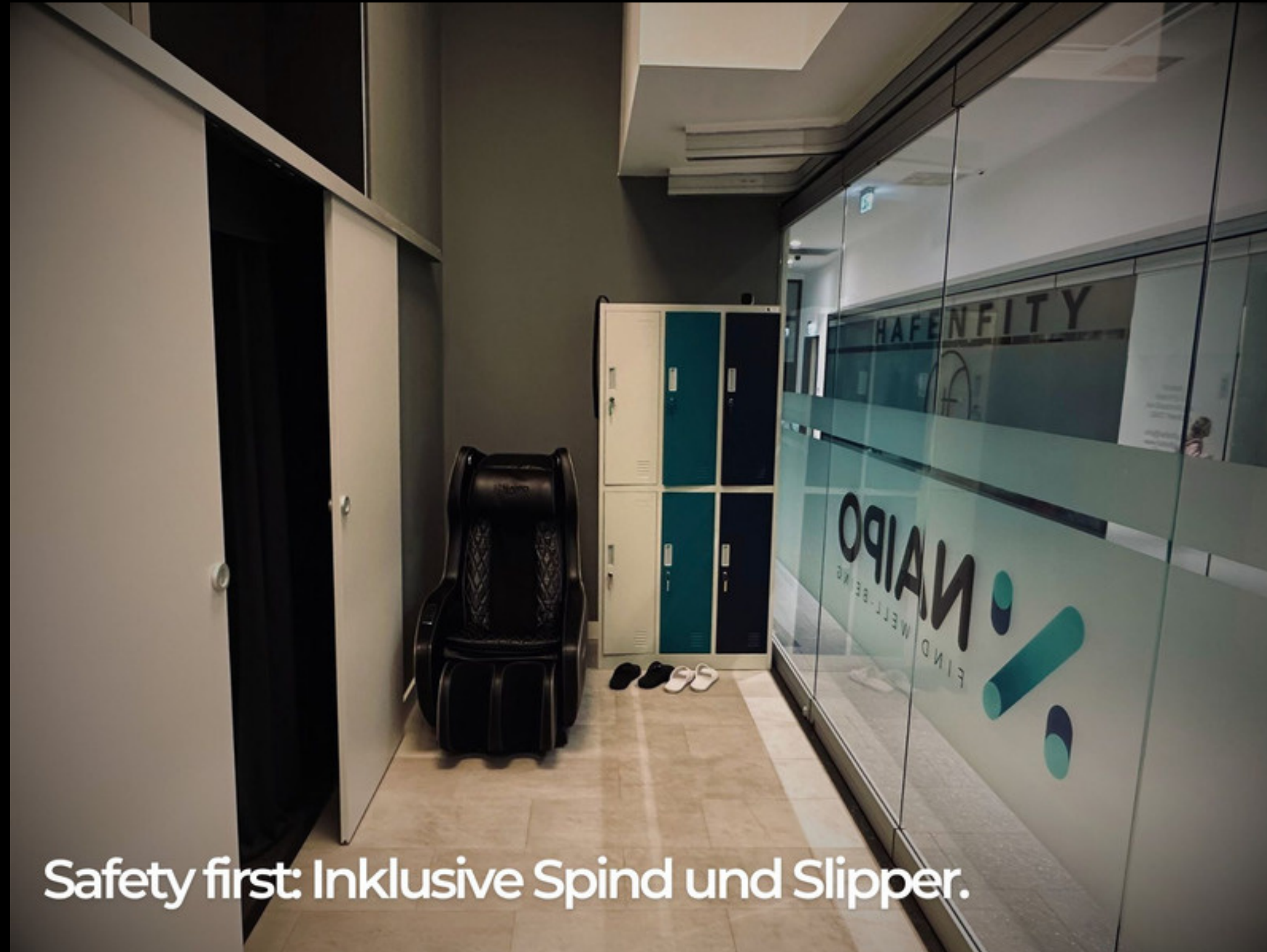
Safety first: Inklusive Spind und Slipper.