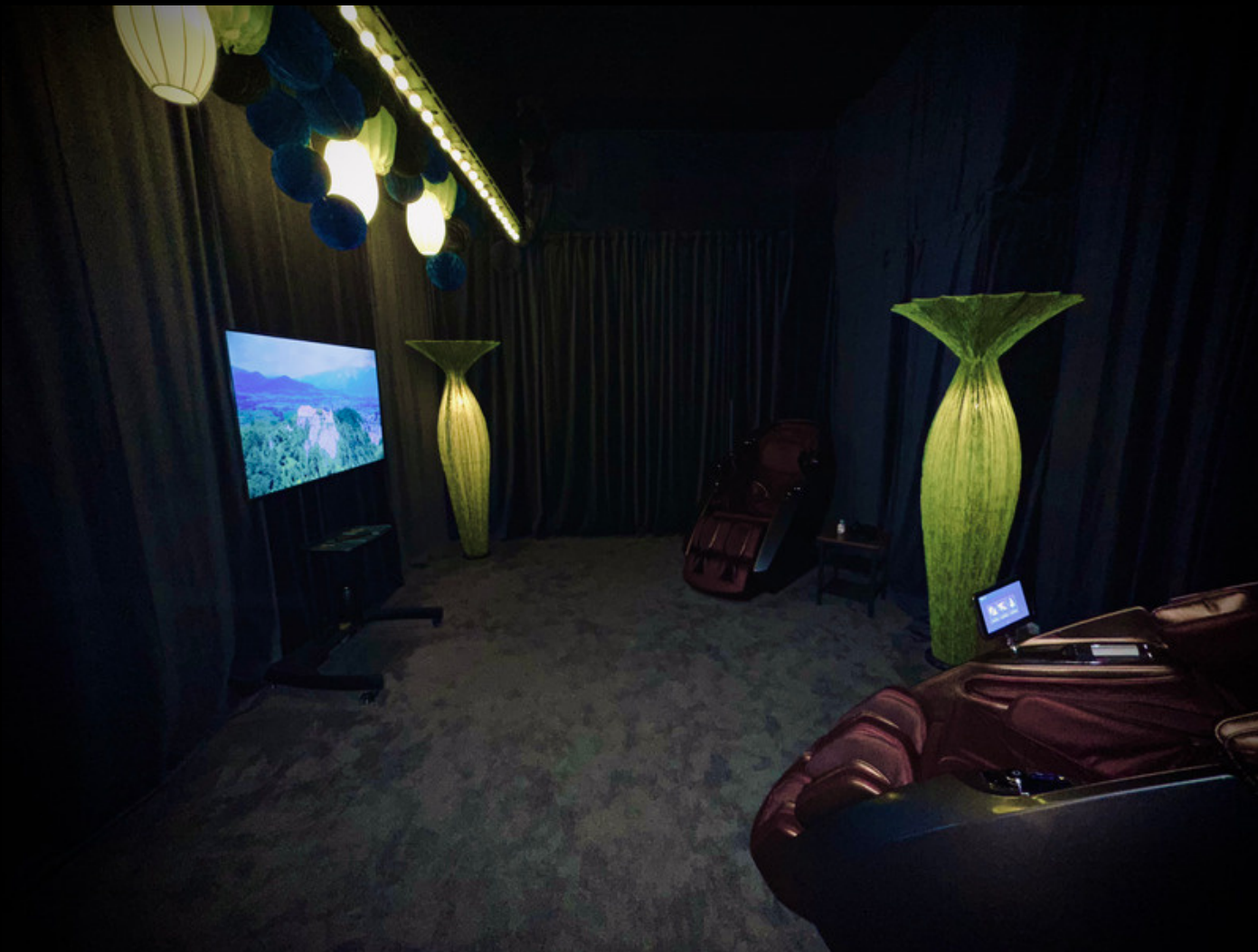
Premium Lounge: Séparée, 30 und 60 Minuten.