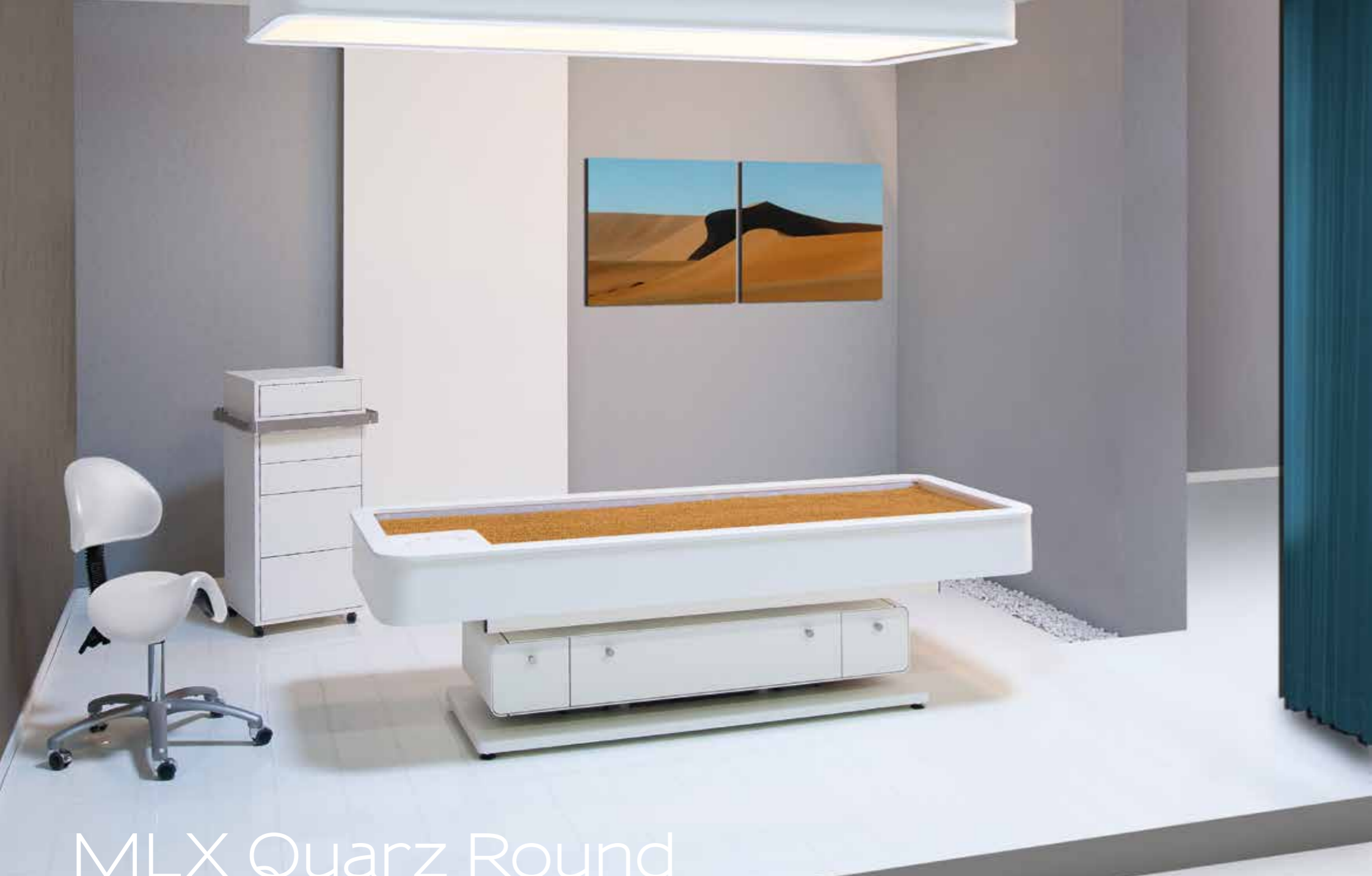
MLX Quarz Round