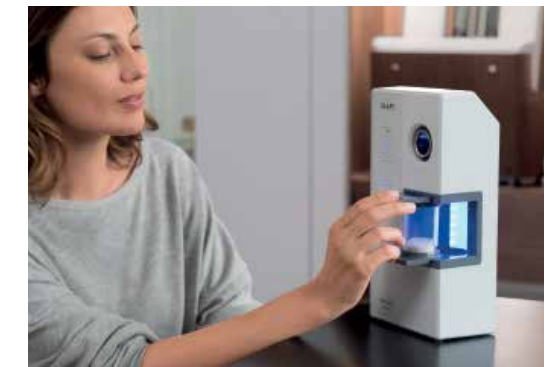
Ganz einfach: Die Halterung führt den Salzbecher beim Einsetzen automatisch in die richtige Position.