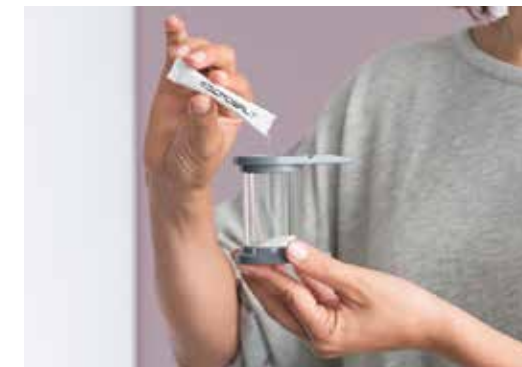
Ganz genau: Die Salzsticks enthalten die optimale Menge Salz für eine Anwendung.

einfach den Becher aus dem Gerät und füllt den Inhalt eines Salzsticks zusammen mit der Zerkleinerungskugel aus Edelstahl ein. Danach nur noch den Becher aus bruchsicherem und spülmaschinenfestem Spezialglas wieder in das Gerät einsetzen – fertig. Das geht fast wie von selbst, weil die Halterung den Salzbecher automatisch in die richtige Position führt.