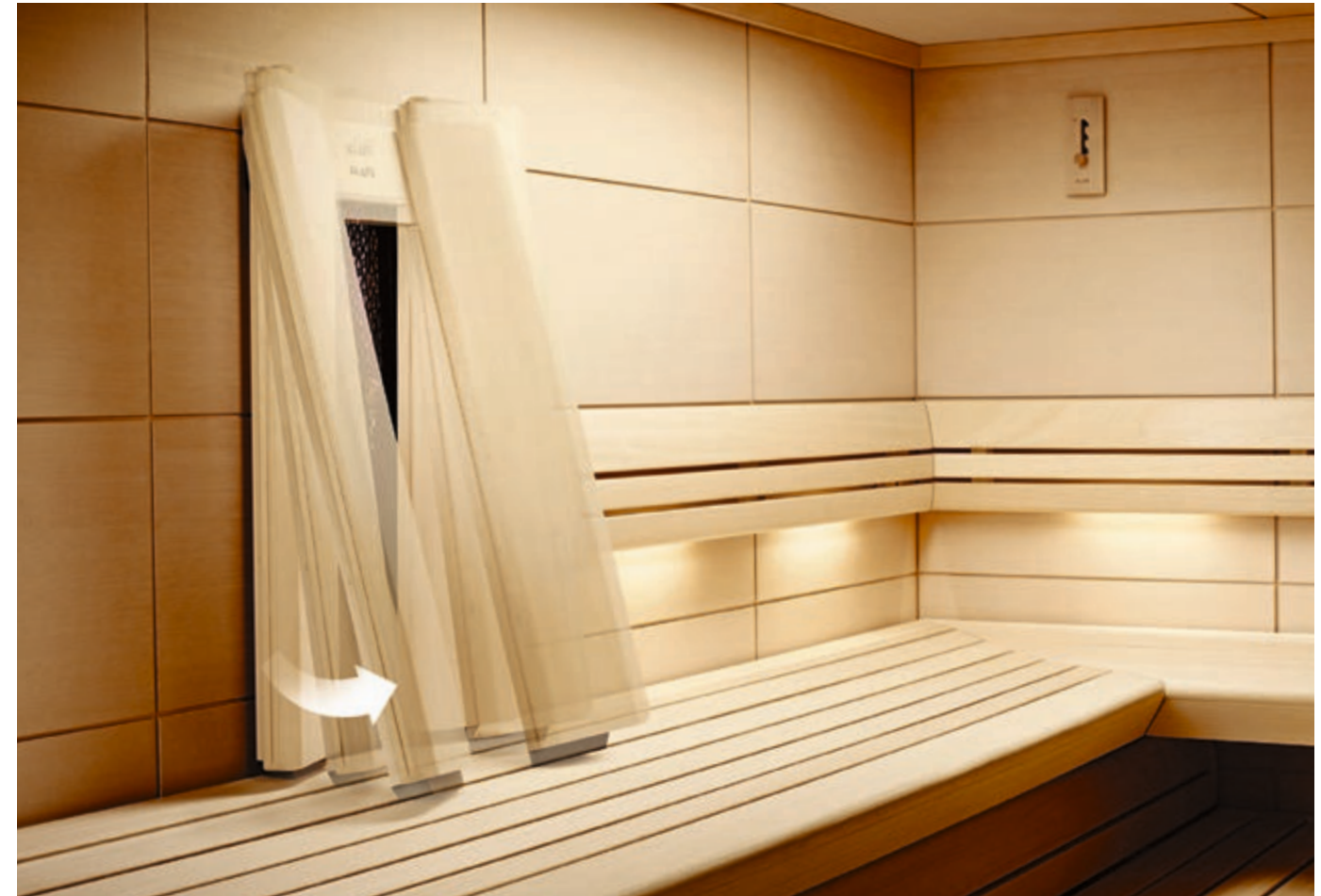
Die Rückenlehne ist mit nur einem Handgriff in mehreren Stufen verstellbar.

für eine kurze Infrarot-Anwendung immer schnell auf eine Wohlfühltemperatur zwi- schen 27 °C und 35 °C aufgeheizt. Für ein bequemes Sitzen auch bei besonders tiefen Saunabänken lässt sich die Rücken- lehne in mehreren Stufen nach vorne ein- stellen. Und sorgt so für einen komfortablen Sitzplatz, natürlich auch wenn Sie sauna- baden. Der patentierte Niedrigtemperatur- Keramikstrahler ist so hochwertig, dass Sie von uns eine lebenslange Garantie darauf bekommen. Auch erfüllt er souverän die Richtlinien der RAL-Gütegemeinschaft Infrarot-Wärmekabinen. So können Sie sicher vollkommen entspannen.