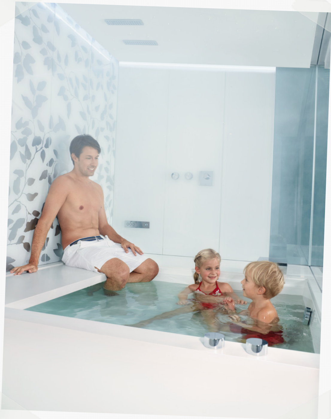
D12 Vario. Baden hoch fünf.