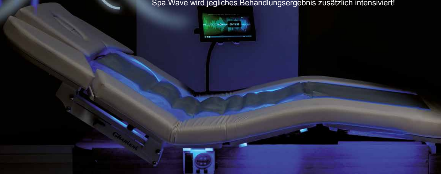
MLW Amphibia mit Spa.Wave System